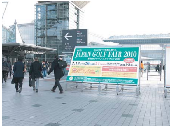
会場の東京ビッグサイト

当協会(=PGS)は、東日本地区連絡協議会が中心となってブースを出展。平成22年度パブリック選手権の開催告知やJGAハンディキャップの普及等について来場者にアピールした。さらに今年はアンケートに答えた方を対象に「お楽しみ抽選会」を実施。東日本地区加盟7コースにて利用できる特別招待券(1等)をはじめ、当協会限定のオリジナルキャップやボストンバックを景品に用意すると、来場者が瞬く間に長蛇の列を作った。