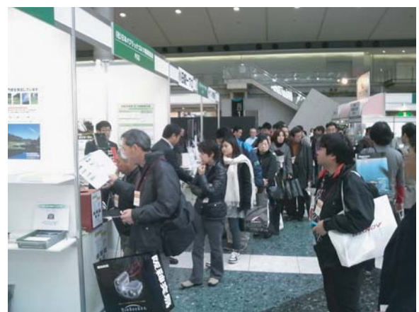
PGSブースには長蛇の列が！

同フェアではブースによる展示だけではなく、ゴルフに関係する各種セミナーも開催されている。ゴルフ市場活性化セミナーでは「2015年問題を乗り越えよう ～ゴルフを好きから夢中へ～」と題した講演を行い、多くの参加者が熱心に受講していた。