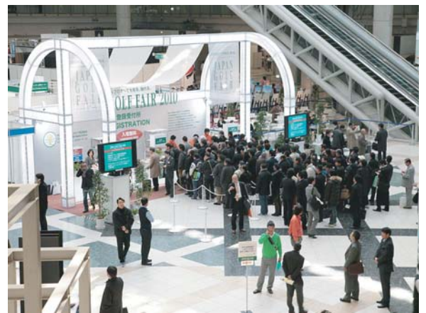
入場受付に並ぶ来場者

2月19日(金)から21日(日)までの3日間、東京ビッグサイトに於いて第44回ジャパンゴルフフェア(主催：社団法人日本ゴルフ用品協会)が開催された。同フェアの基本方針は「日本のゴルフの活性化を最大の目標としつつ、さらに国際性を追求し、アジアを代表するインターナショナルなゴルフショーを目指す」というもの。各ゴルフ関連企業のブースが立ち並び、会場には3日間で 50,876名 が訪れた。